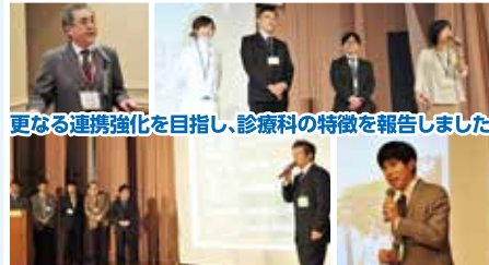
更なる連携強化を目指し、診療科の特徴を報告しました