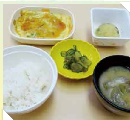
かに玉、きゅうり和え物、さつま芋とリンゴの甘煮