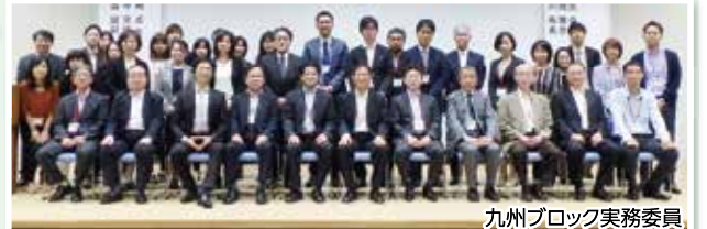
九州ブロック実務委員

日本赤十字社臨床検査技術会の主催で九州ブロックが担当し11月11日～11月12日に沖縄県市町村自治会館で開催し、全国から関係者150名が参加しました。