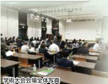
学術大会会場全体写真