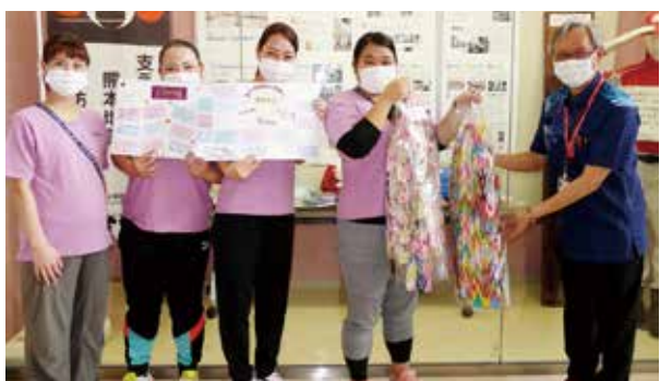
千羽鶴と寄せ書き