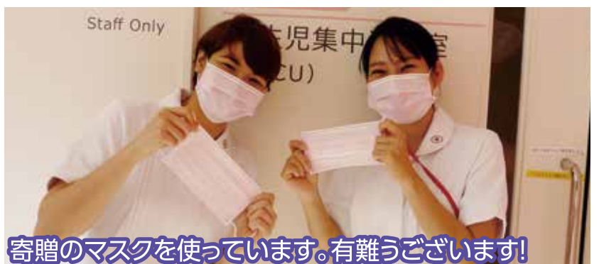
寄贈のマスクを使っています。有難うございます！