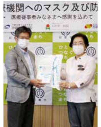
那覇市からの応援