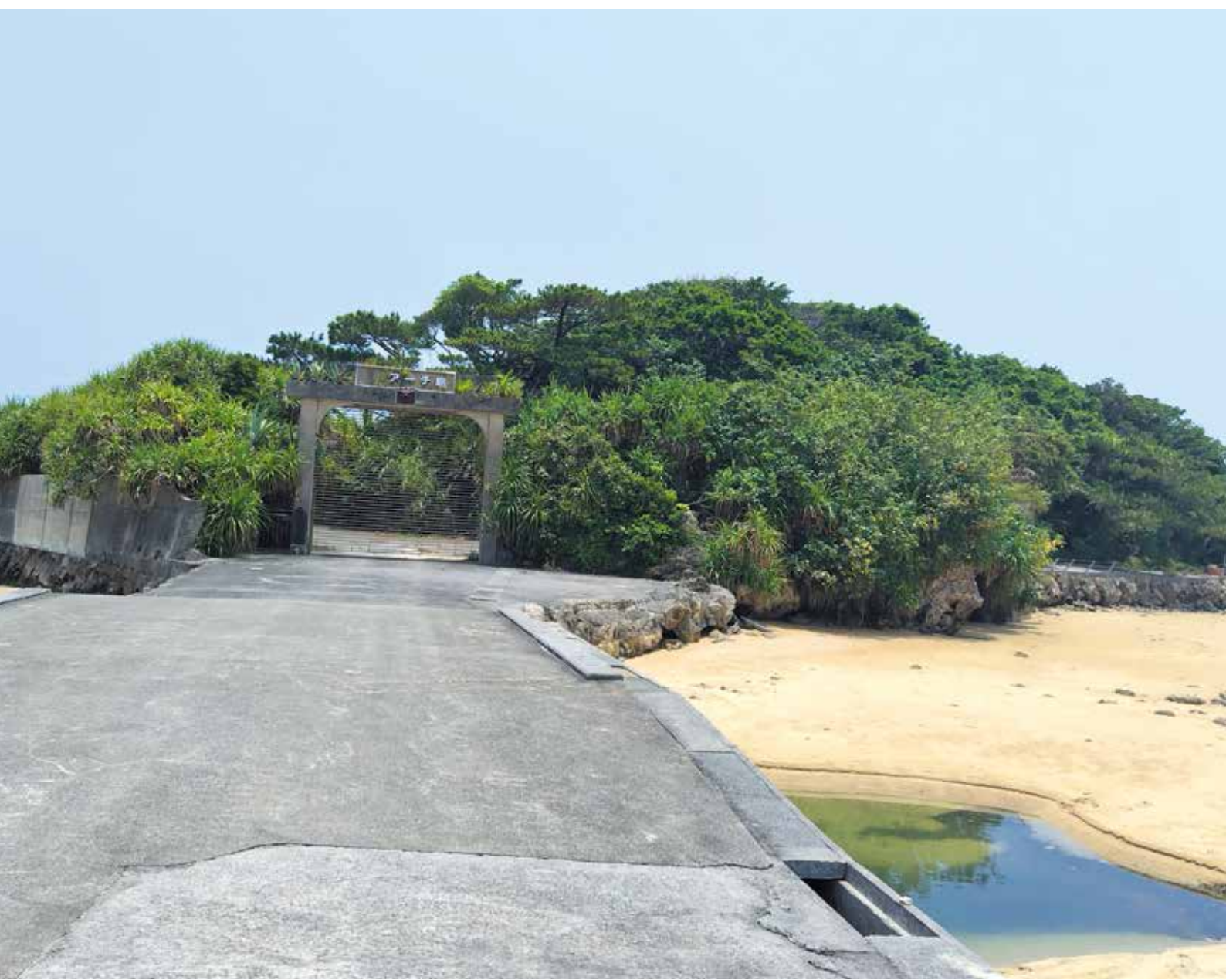
【タイトル:アーヂ島】